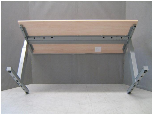
Figuur 3: Beproefd exemplaar 12.0866-3 van Voortman Hi Tee bureautafel, hoogte instelbaar- onderaanzicht