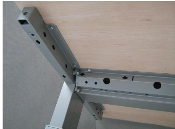
Figuur 4: Beproefd exemplaar 12.0866-3 van Voortman Hi Tee bureautafel, hoogte instelbaar- detail bevestiging poot aan traverse