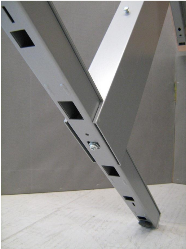
Figuur 5: Beproefd exemplaar 12.0866- van Hi Tee bureautafel, hoogte instelbaar- detail onderaanzicht bevestiging liggende deel aan staande deel van de poot