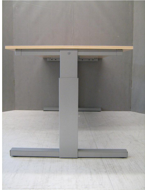
Figuur 2: Beproefd exemplaar 12.0866- van Hi Tee bureautafel, hoogte instelbaar- zij aanzicht