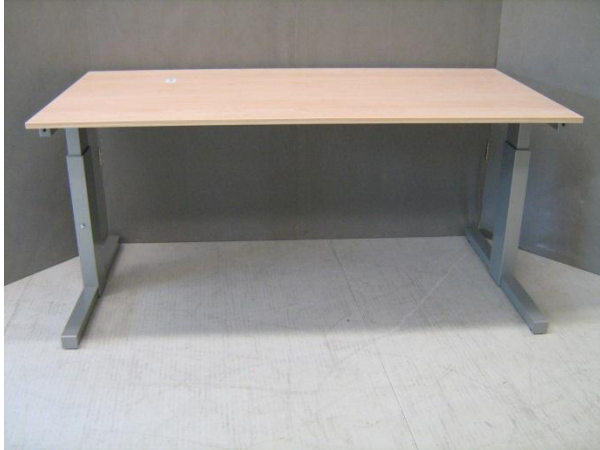
Figuur 1: Beproefd exemplaar 12.0866- van Hi Tee bureautafel, hoogte instelbaar- vooraanzicht.