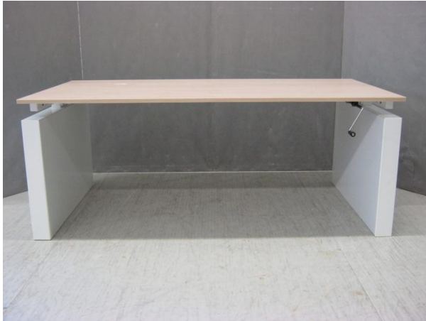
Figuur 1: Beproefd exemplaar 12.0866-1 van Voortman Hi Tee wangen bureautafel, slingerverstelbaar- laagste stand vooraanzicht.