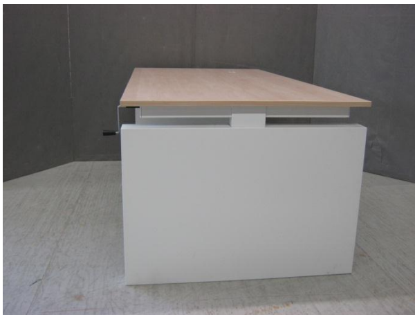
Figuur 3: Beproefd exemplaar 12.0866-1 van Voortman Hi Tee wangen bureautafel, slingerverstelbaar – laagste stand zij-aanzicht