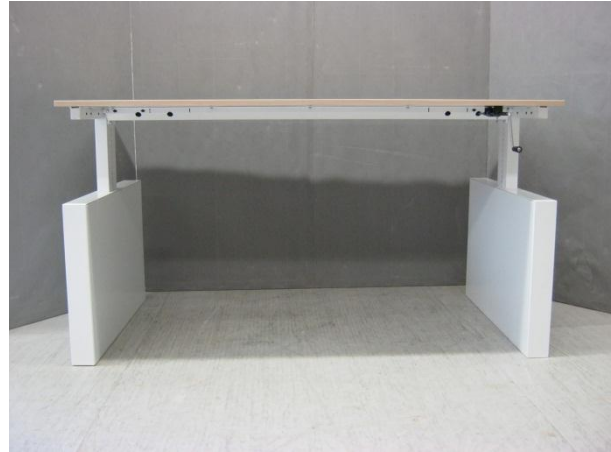
Figuur 2: Beproefd exemplaar 12.0866-1 van Voortman Hi Tee wangen bureautafel, slingerverstelbaar- hoogste stand vooraanzicht.