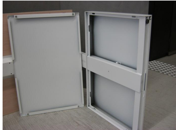
Figuur 8: Beproefd exemplaar 12.0866-1 van Voortman Hi Tee wangen bureautafel, slingerverstelbaar- aanzicht binnenzijde wang