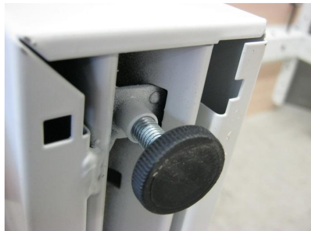
Figuur 10: Beproefd exemplaar 12.0866-1 van Voortman Hi Tee wangen bureautafel, slingerverstelbaar- onderaanzicht detail stel poot