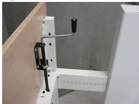
Figuur 6: Beproefd exemplaar 12.0866-1 van Voortman Hi Tee wangen bureautafel, slingerverstelbaar- detail hoogte verstelling