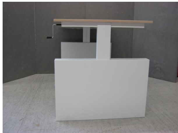
Figuur 4: Beproefd exemplaar 12.0866-1 van Voortman Hi Tee wangen bureautafel, slingerverstelbaar – hoogste stand zij-aanzicht onderaanzicht detail 1