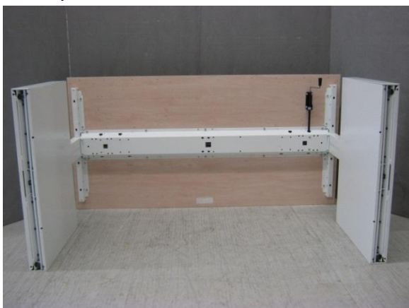
Figuur 5: Beproefd exemplaar 12.0866-1 van Voortman Hi Tee wangen bureautafel, slingerverstelbaar- onderaanzicht