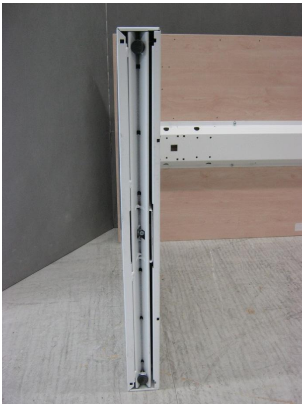
Figuur 9: Beproefd exemplaar 12.0866-1 van Voortman Hi Tee wangen bureautafel, slingerverstelbaar – onderaanzicht poot