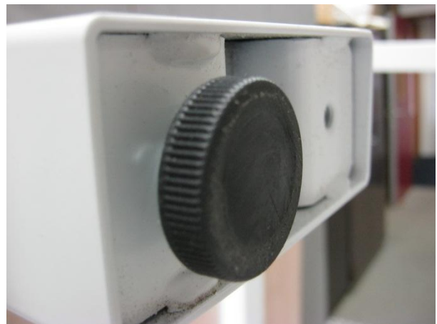
Figuur 10: Beproefd exemplaar 12.0866-2 van Voortman Hi Tee duo open werkplek, slingerverstelbaar-onderaanzicht detail stel poot