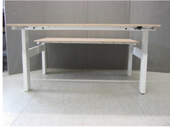
Figuur 2: Beproefd exemplaar 12.0866-2 van Voortman Hi Tee duo open werkplek, slingerverstelbaar- hoogste stand vooraanzicht.