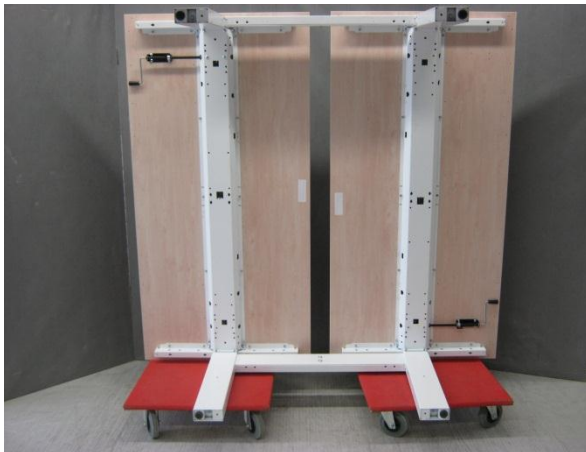
Figuur 5: Beproefd exemplaar 12.0866-2 van Voortman Hi Tee duo open werkplek, slingerverstelbaar- onderaanzicht