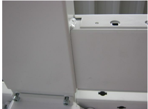
Figuur 8: Beproefd exemplaar 12.0866-2 van Voortman Hi Tee duo open werkplek, slingerverstelbaar- detail verbinding poot aan dwarsligger die de verbinding vormt naar de andere poot