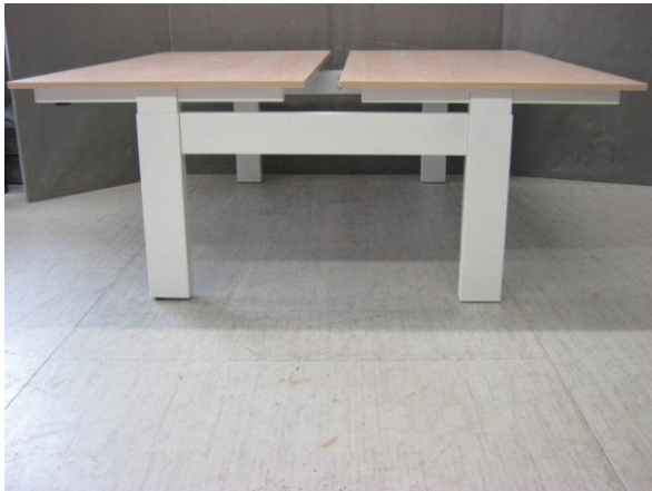
Figuur 3: Beproefd exemplaar 12.0866-2 van Voortman Hi Tee duo open werkplek, slingerverstelbaar – laagste stand zij-aanzicht