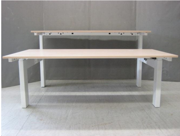
Figuur 1: Beproefd exemplaar 12.0866-2 van Voortman Hi Tee duo open werkplek, slingerverstelbaar- laagste stand vooraanzicht.