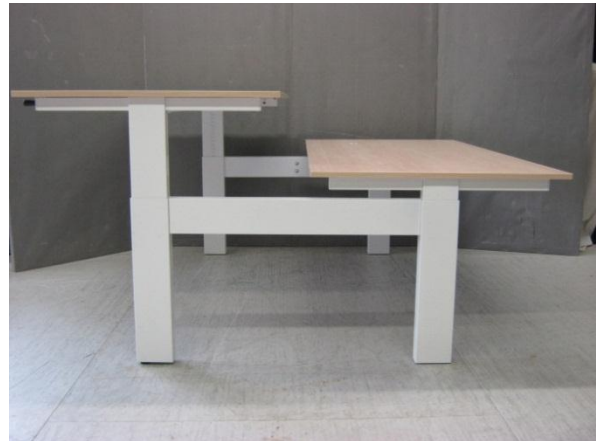
Figuur 4: Beproefd exemplaar 12.0866-2 van Voortman Hi Tee duo open werkplek, slingerverstelbaar- – hoogste stand zij-aanzicht