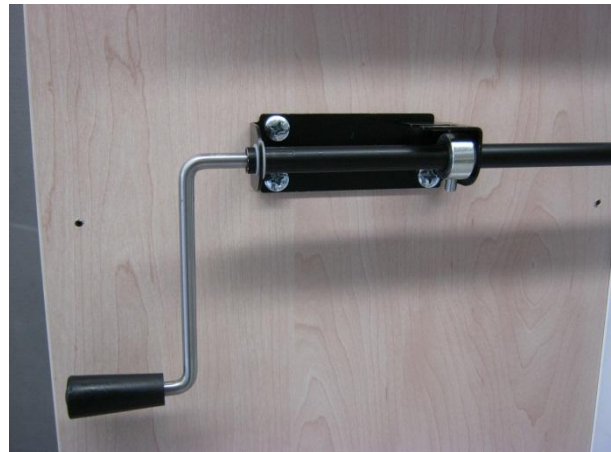
Figuur 6: Beproefd exemplaar 12.0866-2 van Voortman Hi Tee duo open werkplek, slingerverstelbaar- detail hoogte verstelling