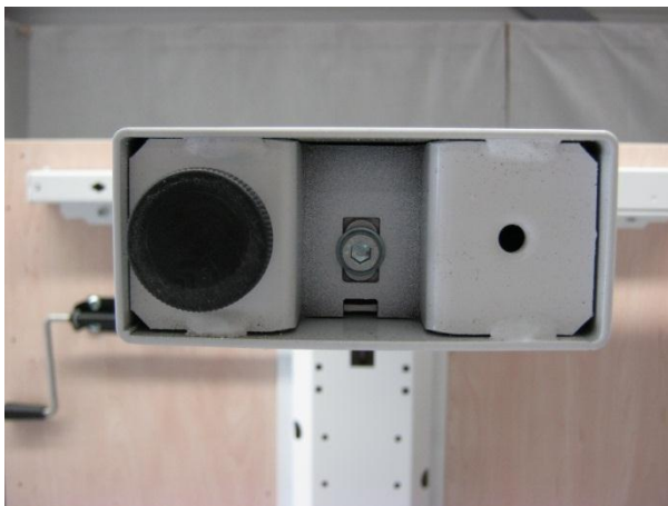
Figuur 9: Beproefd exemplaar 12.0866-2 van Voortman Hi Tee duo open werkplek, slingerverstelbaar – onderaanzicht poot